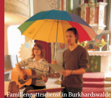
Familiengottesdienst in Burkhardswalde