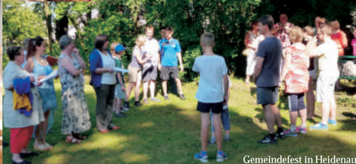
Gemeindefest in Heidenau