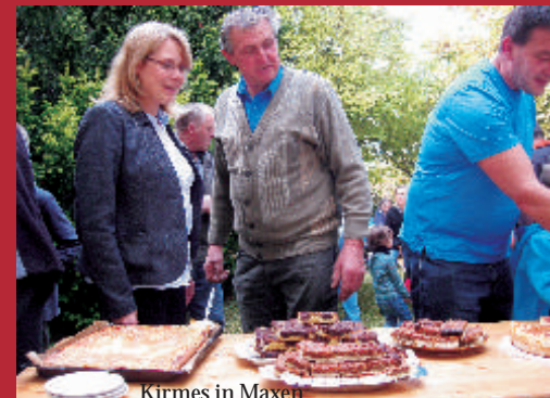
Kirmes in Maxen

Ev.-Luth. Kirchgemeinden Heidenau-Dohna-Burkhardswalde und Maxen Dezember 2013 / Januar 2014