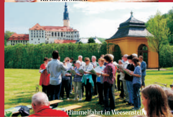
Himmelfahrt in Weesenstein