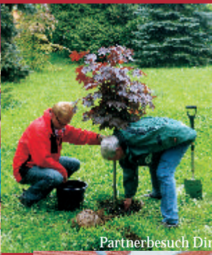
Partnerbesuch Dinxperlo in Heidenau