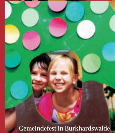
Gemeindefest in Burkhardswalde