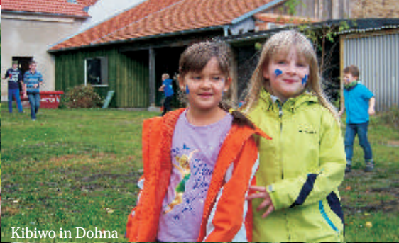
Kibiwo in Dohna