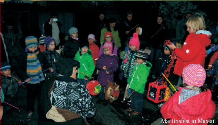
Martinsfest in Maxen