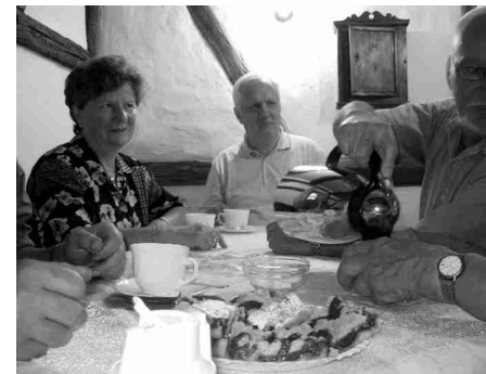
Kleine Kaffeepause im Pfarrhäuser-Museum

Wir bestaunten die große Stadtkirche „Zu unserer lieben Frauen“ in Mittweida und erfreuten uns an der Führung und Ausstellung im Pfarrhäuser-Museum.