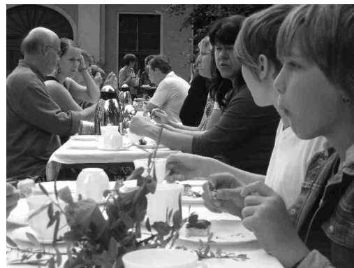
Kaffeetafel in Dohna nach dem Gottesdienst

In Dohna und Burkhardswalde war erstmals eine Band zu hören, bestehend aus Konfirmanden der 8. Klasse und Jugendlichen der Jungen Gemeinde. Ihr habt Eure Sache gut gemacht! Vielen Dank! Wir freuen uns schon auf das nächste Mal.