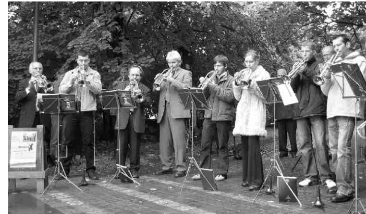
Posaunenchor Dohna beim öffentlichen Blasen 2005

Auch in diesem Jahr lädt der Posaunenchor Dohna Sie herzlich ein, am Sonntag, dem 21. Juni, 9.30 Uhr in einem Gottesdienst die diesjährige